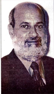
L'Ambassadeur de l'Israël en Côte d'Ivoire, SEM Omer Benny

Depuis samedi dernier, une mission de prospection économique d'hommes d'affaires israéliens séjourne en Côte d'Ivoire. Cette présence fait suite à une initiative de l'Ambassadeur d'Israël en Côte d'Ivoire, SEM Omer Benny.